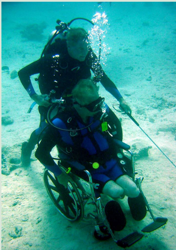
De blinde Barber duwt zijn invalide vriend over de bodem van de Rode Zee. Laat je niet leiden door je beperkingen.

Mensen die beter tot hun recht komen, zijn productiever. Dit is het fundament voor de florerende organisatie.